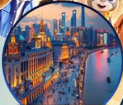
หาดไวทาน