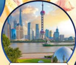
นอร์ทปิ่น กรีนแลนด์