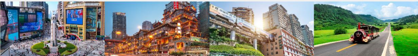
ถนนเจี๋ยฟางเป่ย์