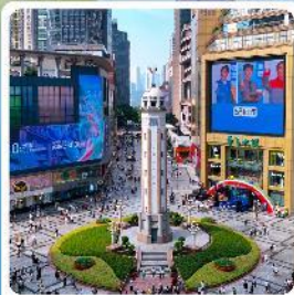
ถนนเจี๋ยฟางเป่ย์