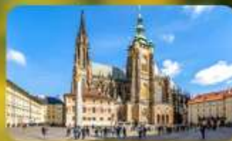
เข้าชม 2 ปราสาท ปราก และเซินบรุนน์