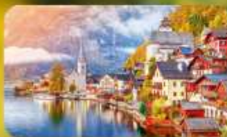
การันตีพัก Hallstatt / St. Wolfgang หรือริมทะเลสาบ 1 คืน