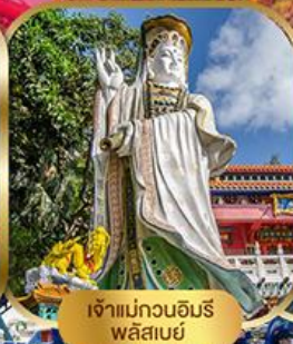
เจ้าแม่กวนอิม พลัสเบย์