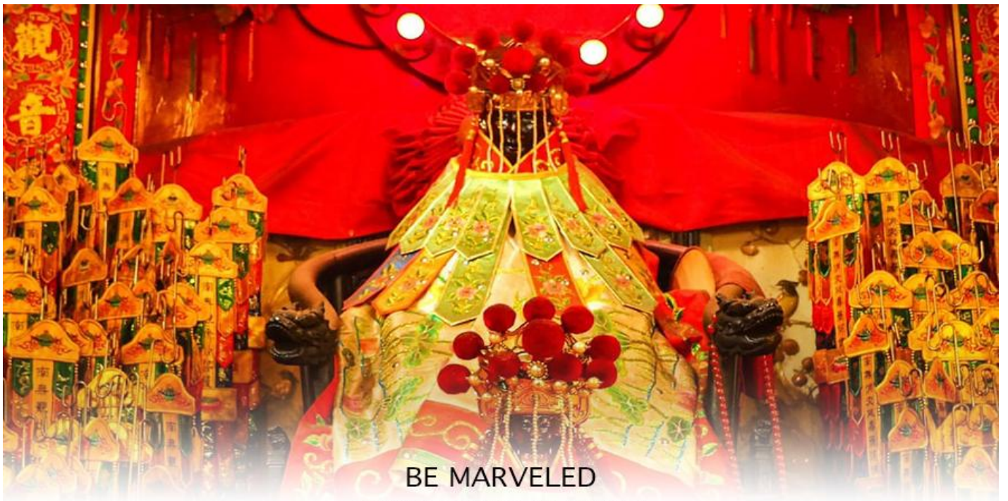
BE MARVELED วัดเจ้าแม่กวนอิมสองอำ (ยิมฮิน)

จากนั้นนำท่านสู่ เจ้าแม่กวนอิม วัดสองอำ (HUNG HOM KWUN YUM TEMPLE) เป็นหนึ่งในวัดที่เก่าแก่ที่สุดของฮ่องกง และชาวฮ่องกงเลื่อมใสศรัทธามาก สร้างขึ้นในปี ค.ศ.1873 ในสมัยช่วงสงครามโลกครั้งที่ 2 มีการปล่อยระเบิดลงบริเวณใกล้กับวัดแห่งนี้หลายต่อหลายครั้ง ทำให้มีผู้บาดเจ็บและล้มตายมากมาย แต่ชาวบ้านที่หนีเข้าไปหลบภัยในวัดนี้ก็กลับปลอดภัยอย่างปาฏิหาริย์ และตัววัดก็ไม่ได้รับความเสียหายจากเหตุการณ์ทิ้งระเบิดที่น่าอัศจรรย์ ตามความเชื่อของคนจีนใน ฮ่องกง-มาเก๊า จะมี "วันเปิดทรัพย์" หรือ "พิธียืมเงิน เจ้าแม่กวนอิมฮ่องกง" เป็นวันที่จะมาขอพรและยืมเงินเจ้าแม่กวนอิม ซึ่งนับจากหลังวันตรุษจีน ไป 26 วัน จะเป็นวันเปิดทรัพย์ที่จัดขึ้นในทุกๆปี พิธีนี้จะมีเพียงครั้งปีละครั้งเท่านั้น เป็นวันสำคัญอีกวันที่คนหลังไหลมาไหว้ขอพรอย่างไม่ขาดสาย