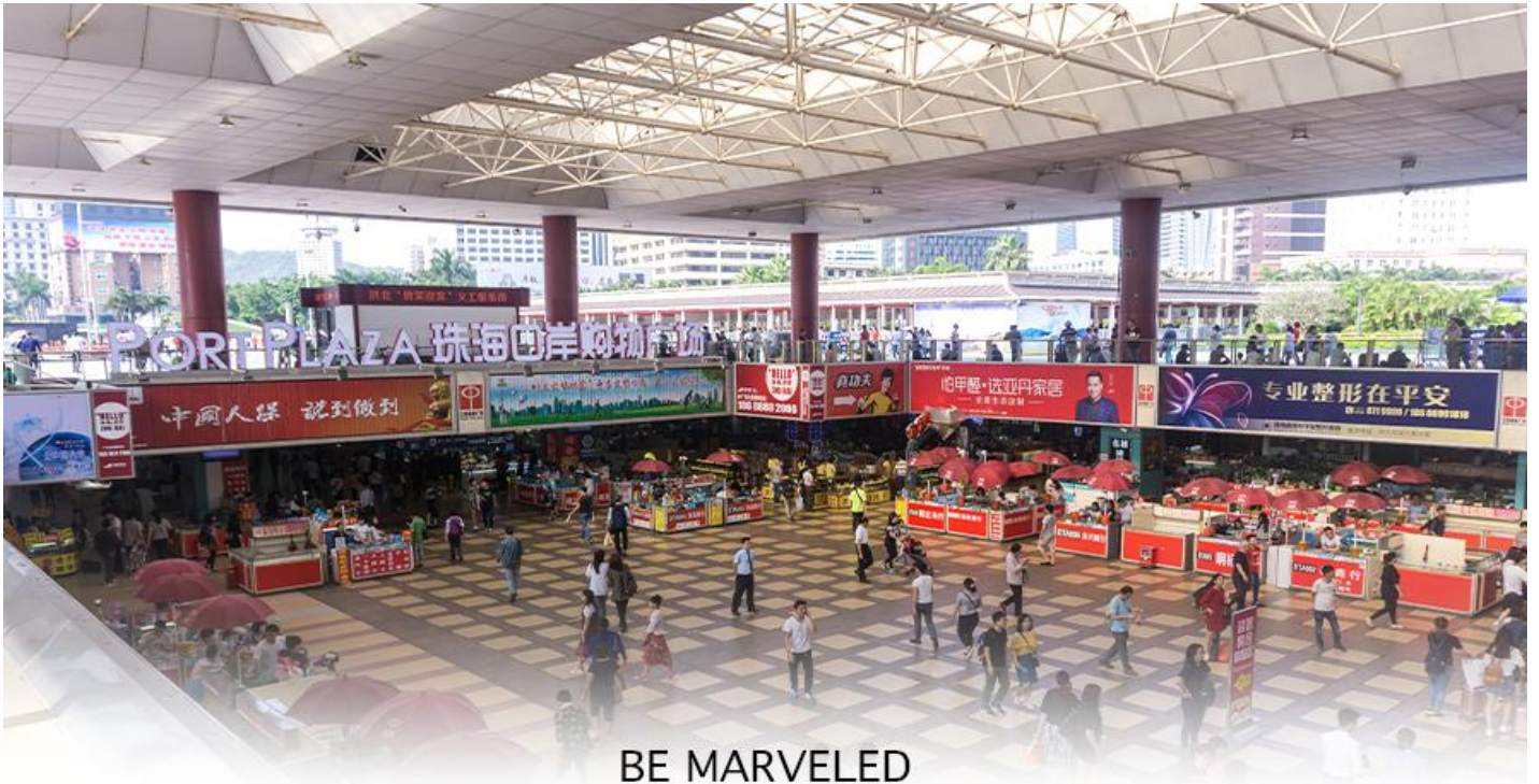
BE MARVELED ตลาดใต้ดิน กวเป่ย์

📍 อิสระอาหารอาหารเย็นตามอัธยาศัย **เพื่อความสะดวกในการซื้อปิ้ง**