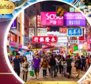
Shopping Tsim Sha Tsui