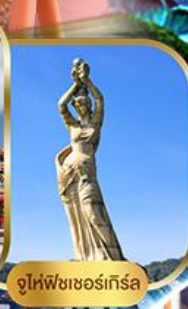
จูไห่ฟิชชอร์ทิสรา