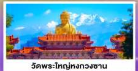
วัดพระใหญ่ทงกวงชาน