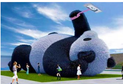
ตุ๊กตาแพนด้าเซลฟี

ระหว่างเดินทางท่านสามารถชมทัศนียภาพธรรมชาติอันงดงามของสองข้างถนนขณะที่รถแล่นผ่าน ที่มีทั้งภูเขาหิมะสูง หุบเขา ธารน้ำ และทุ่งหญ้าบนที่ราบสูง หรือพักผ่อนตามอัธยาศัยบนรถระหว่างเดินทาง