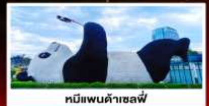
หมีแพนด้าเซลฟี่