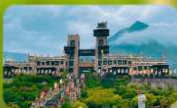
หมู่บ้านโบราณชนเผ่าเซียง