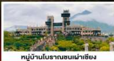
หมู่บ้านโบราณชนเผ่าเซียง