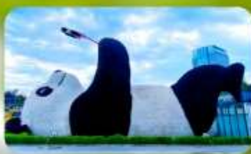
หมีแพนด้าเซลฟี่