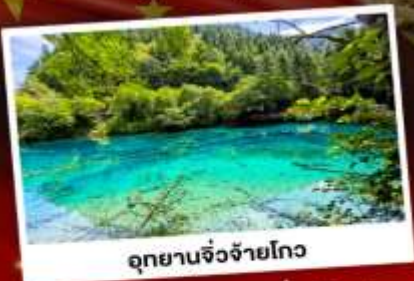
อุทยานจ๋องจ๋ายโกว