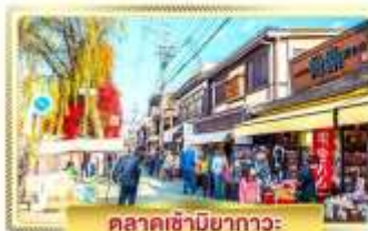
ตลาดเข้ามียากาวะ