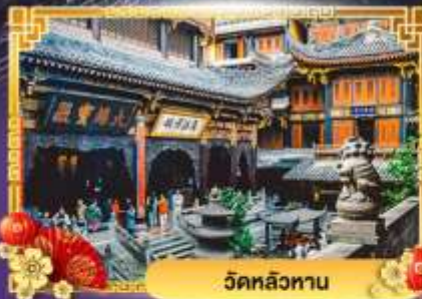
วัดหลิวทาน