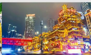
หงหยาดัง(ชมไฟยามค่ำคืน)

*ทางบริษัทฯ ขอสงวนสิทธิ์ในการสลับโปรแกรมทัวร์ตามความเหมาะสมขึ้นอยู่กับสถานการณ์หน้างาน โดยคำนึงถึงผลประโยชน์ของลูกค้าเป็นสำคัญ