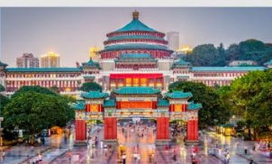
ศาลาประชาคม