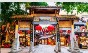
หมู่บ้านโบราณฉือชิว