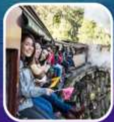
รถไฟจักรไอน้ำโบราณ