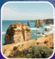
Great Ocean Road (ครึ่งสาย)