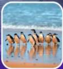
เพนกวินที่เกาะฟิลลิป