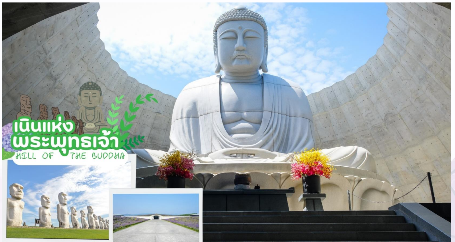
เนินแห่งพระพุทธรเจ้า HILL OF THE BUDDHA

นำท่านเดินทางสู่ เนินแห่งพระพุทธรเจ้า หรือ Hill of the Buddha ตั้งอยู่ทางตอนเหนือของเมืองซัปโปโร ที่ถูกออกแบบโดย Mr.Tadao ando สถาปนิกชื่อดังชาวญี่ปุ่น พระพุทธรูปมีความสูงถึง 13.5 เมตร และมีน้ำหนักมากถึง 1500 ตัน ล้อมรอบด้วยธรรมชาติที่สวยงามแตกต่างกันออกไปในแต่ละฤดู ฤดูหนาวก็จะรู้สึกได้ถึงความงดงามของหิมะที่ขาวโพลน นับได้ว่าเป็นอีกหนึ่งสถานที่ๆเรียกได้ว่าเป็น Unseen Hokkaido เลยทีเดียว จากนั้นนำท่านชม โมอายแห่งเมืองฮอกไกโด หรือที่เรียกว่า