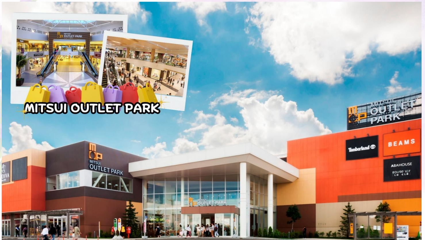
กลางวัน อีสรอาหารกลางวันตามอัยาศัย ณ MITSUI OUTLET PARK SAPPORO