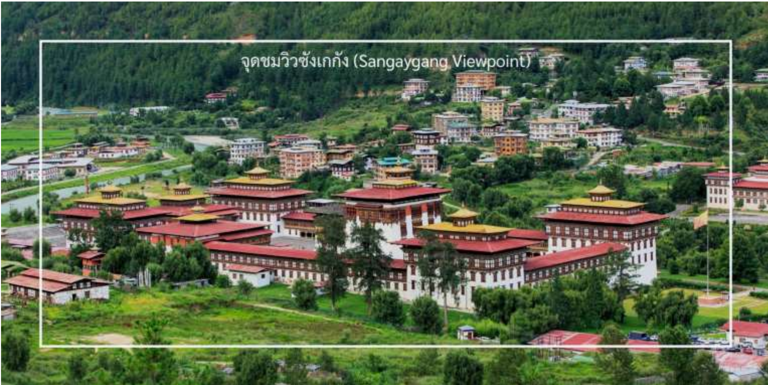
จุดชมวิวซังเกกัง (Sangaygang Viewpoint)

ออกเดินทางสู่เมืองพาร์ โดยใช้เวลาเดินทางประมาณ 50 นาที