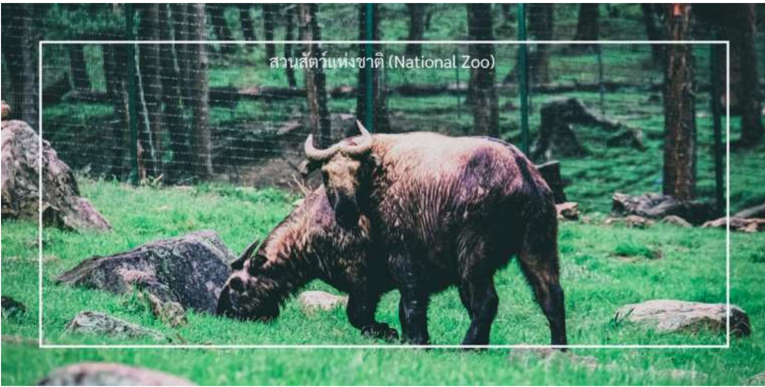
สวนสัตว์แห่งชาติ (National Zoo)

เที่ยวชม จุดชมวิวซังเกกัง (Sangaygang Viewpoint) เป็นหนึ่งในจุดชมวิวที่สวยงามในเมืองทิมพู (Thimphu) ตั้งอยู่บนเนินเขาที่สูง ทำให้ผู้เข้าชมสามารถมองเห็นทิวทัศน์ที่งดงามของเมืองทิมพูและภูเขารอบๆ จุดชมวิวนี้อีกมีทิวทัศน์ที่สวยงามของเมืองทิมพูและเทือกเขาหิมาลัย โดยเฉพาะในวันที่อากาศแจ่มใส นักท่องเที่ยวสามารถเห็นวิวที่กว้างไกลได้อย่างชัดเจน