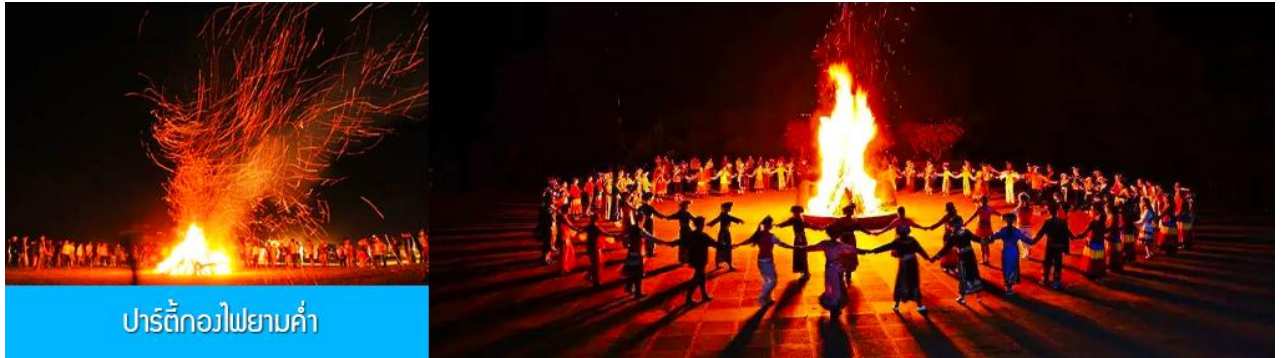
ปาร์ตี้กองไฟยามค่ำ