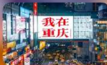
ถนนกวนอิมเฉียว