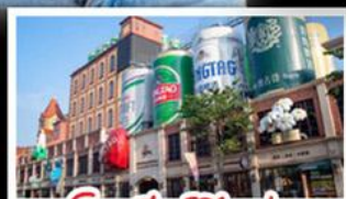
โรงแรมเป็ยริชิงเต่า