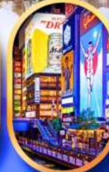
ย่านชิบะฮาชิจิ