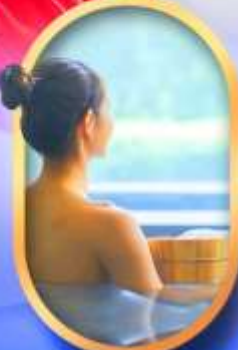
พักโรงแรมออนเซ็น