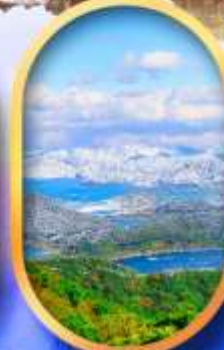
ทะเลสาบมิกะตะ