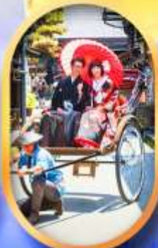
ศาลเจ้าจิ้งจอก