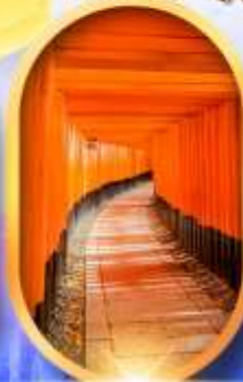
เมืองเก่าทาคายาม่า