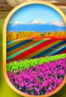
สวนดอกไม้ซึซึชิ