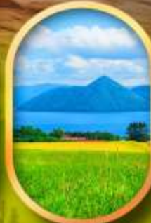
ทะเลสาบโทยะ