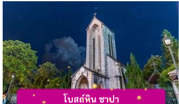
โบสถ์หิน ซาปา