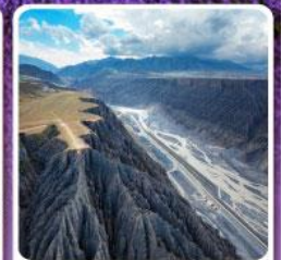
แกรนด์แคนยอนคู่ซานจื่อ