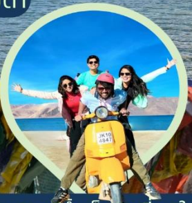
ทะเลสาบน้ำเค็มสูงที่สุดในโลก แปงกอง