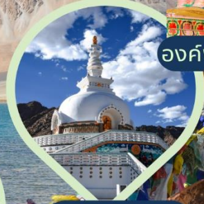
เจดีย์สันติภาพ