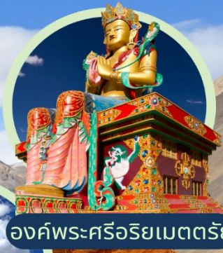
องค์พระศรีอริยเมตตรีย์