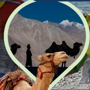
ซิลส์ ซ็ือซุ ทะเลทราย กลางอ้อมกอดหิมาลัย