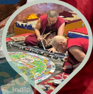
พระลามะ ผู้มีวัตรปฏิบัติ อันอัศจรรย์

บ่อน้ำเค็มดาวทะเลแปงกอง 1 ปี STAR IN THE DUNE