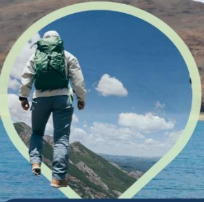
สวยสะกดทุกวิว ไปให้เห็นด้วยตา แล้วใช้ใจ...จดจำ