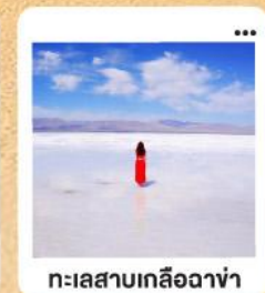
ทะเลสาบเกลือฉาซ่า