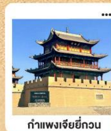
กำแพงเจียยี่กวน