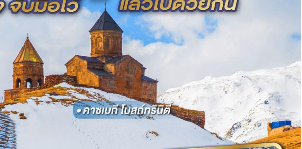
• คาซเบก โบสถ์กรนิต