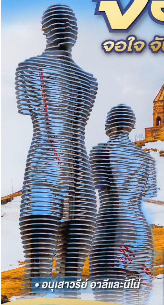
• อนุสาวรีย์ อาลีและนีโน่