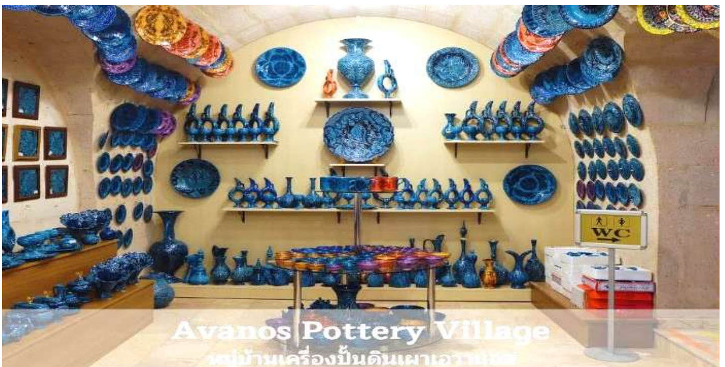
Avanos Pottery Village หมู่บ้านเครื่องปั้นดินเผาอวานอส

นำท่านแวะชม หมู่บ้านเครื่องปั้นดินเผาอวานอส (AVANOS) หมู่บ้านที่มีชื่อเสียงเกี่ยวกับเครื่องปั้นดินเผา อุปกรณ์ที่ใช้ภายในบ้าน ถ้วย, ชาม, ไห, โอง, แจกัน และเครื่องประดับบ้าน