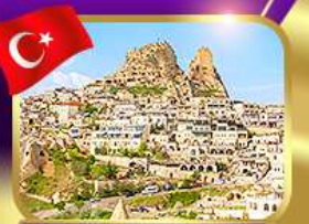
หุบเขาอูซซาร์ คัปปาโดเกีย