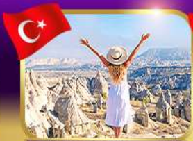
ชมความงาม หุบเขาแห่งรัก