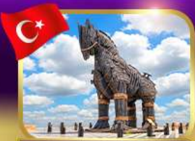
ม้าไม้เมืองทรอย ซานิคาลัส