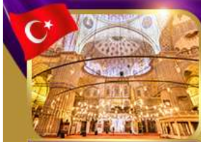
เข้าชมความงามสุเหร่าสีน้ำเงิน