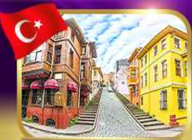
ชมบ้านหลากสีย่านบาลีก