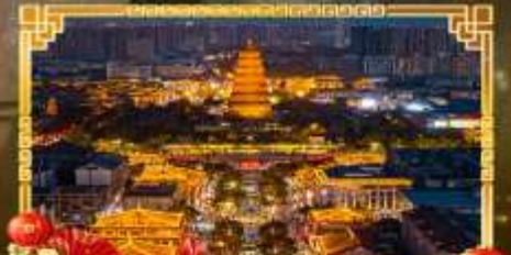
ถนนคนเดินราชวงศ์ถัง