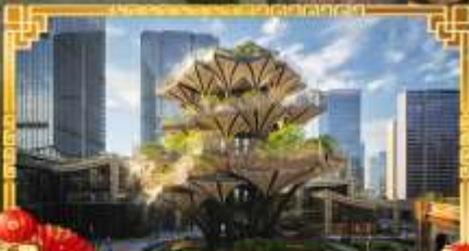
XIAN TREE&MIXC MALL