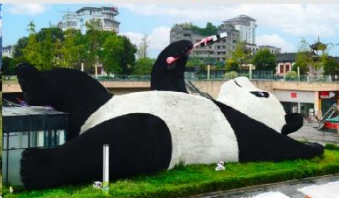
รูปปั้นหมีแพนด้าอนเซลฟี่