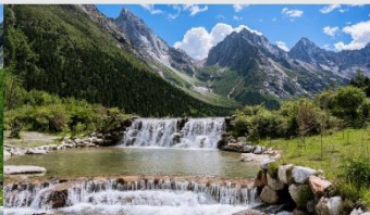
อุทยานแห่งชาติปี่เฟิงโกว