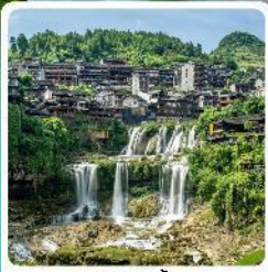
ฟูหลงเจิน