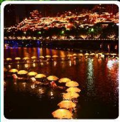
เมืองเซียนเอิน