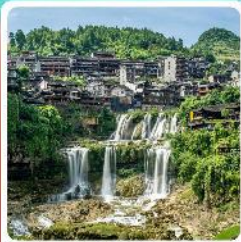
ฟูหลงเจิน

• ไซโล่ อุกยานเทียนเหมินซาน ชมประตูสวรรค์ หุบเขาอวตาร หมู่บ้านโบราณฟูหลงเจิน และพิพิธภัณฑ์ ล่องเรือทะเลสาบเป่าเฟิงหู