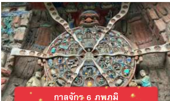
กาลจักร 6 ภพภูมิ