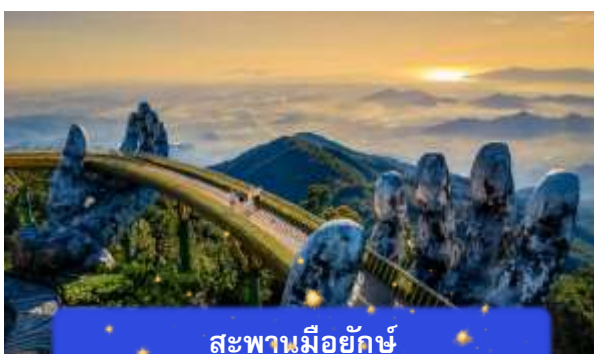
สะพานมียักษ์

เที่ยง อีศระอาหารกลางวันเพื่อความสะดวกในการท่องเที่ยว