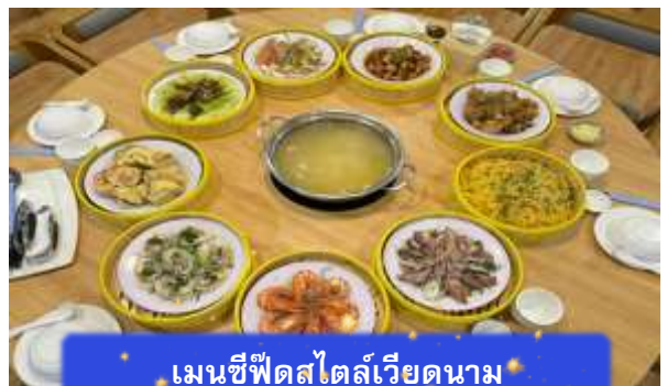
เมนูซีฟู้ดสไตล์เวียดนาม