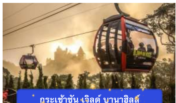
กระเช้าขึ้น เวิลด์ บานาฮิลล์