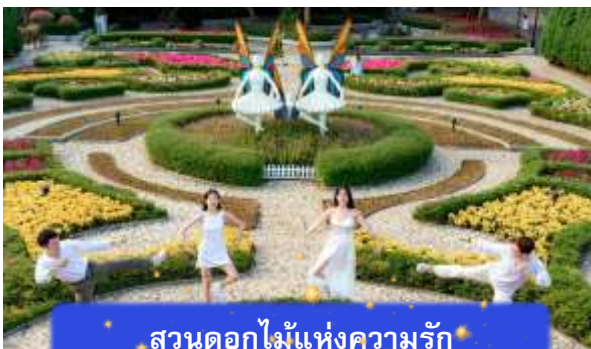
สวนดอกไม้แห่งความรัก

อิสระท่านท่องเที่ยว สวนสนุกแพนตาซีพาร์ค ซึ่งมีเครื่องเล่นหลากหลายรูปแบบ เช่น ทำทนายความมันส์ของหนัง 4D ระทึกขวัญกับบ้านผีสิง เกมส์สนุกๆ เครื่องเล่นเบาๆ รถบั้ง หรือจะเลือกซื้อป๊อปปิ้งของที่ระลึกของสวนสนุก และ จัตุรัสแห่งดวงดาว เปรียบเสมือนการเดินทางสู่อาณาจักรแห่งดวงดาวที่มีเส้นทางเชื่อมต่อระหว่างอาณาจักรแห่งดวงจันทร์และอาณาจักรแห่งดวงอาทิตย์ถนนที่แสนงดงาม และสถาปัตยกรรมที่ล้ำสมัยจุดเด่นของที่แห่งนี้ก็คือกระจกใสทรงสามเหลี่ยมที่ดูคล้ายกับพิพิธภัณฑลู่ฟวร์ที่ฝรั่งเศส ให้ความรู้สึกลเหมือนท่านกำลังท่องอยู่ในโลกแห่งเวทมนต์และดวงดาว (ไม่รวมค่าเข้าชมหุ่นขี้ผึ้งราคาประมาณ 1 แส่นดอง)