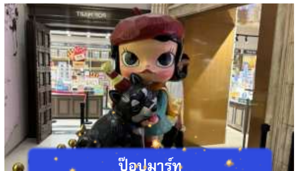
ป๊อปมาร์ท