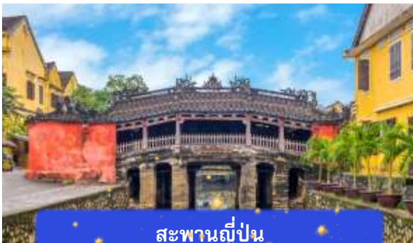
สะพานญี่ปุ่น

จากนั้นนำท่านเดินทางสู่ เมืองโบราณฮอยอัน เมืองมรดกโลกที่ยังคงเอกลักษณ์และรักษาวัฒนธรรมไว้อย่างดีเยี่ยม โดยท่านสามารถเดินเล่น ถ่ายรูป ตามตรอกซอกซอยต่างๆ ได้ ไฮไลท์ของการมาถ่ายรูประบุเช็คอินที่นี่คือการได้ขึ้นไปถ่ายรูปจากมุมสูงของคาเฟ่ที่อยู่ตามซอกซอย นำท่านชม สะพานญี่ปุ่น สะพานแห่งมิตรไมตรี ที่ได้ชื่อนี้เนื่องจากสะพานแห่งนี้สร้างขึ้นโดยชุมชนชาวญี่ปุ่น เป็นสะพานที่สร้างขึ้นข้ามคลองที่ในอดีต 400 ปีกว่าที่ผ่านมา