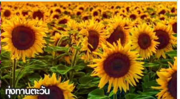
ทุ่งทานตะวัน

จากนั้นนำท่านสู่ ถนนหวังฝูจิ่ง ถนนคนเดินสุดฮิตใจกลางกรุงปักกิ่ง ปัจจุบันถนนนี้เป็นที่นิยมมากในหมู่นักช้อปปิ้งและนักท่องเที่ยวที่ตบเท้าเข้ามาเพื่อเสาะหาของลดราคาและเสื้อผ้าที่มีเอกลักษณ์ไม่ซ้ำใคร ถนนการค้าที่พลุกพล่านแห่งนี้มีมีมานั่ง บาร์ ร้านอาหาร และคาเฟ่เรียงรายตลอดทางอยู่บนถนนคนเดินสายนี้ ให้ท่านได้ช้อปปิ้งร้าน Pop Mart ที่ใหญ่ที่สุดในปักกิ่งตุ๊กตา box หน้าตาน่ารักที่ดังที่สุดในจีนตอนนี้ ต้องยกให้กับ Pop Mart