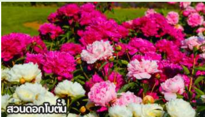
สวนดอกไม้ต้น

เดือนสิงหาคม-ต้นกันยายน ชมทุ่งดอกเบญจมาศหรือดอกไฮเดรนเยีย ดอกเบญจมาศปักกิ่งหมายถึงสายพันธุ์เบญจมาศที่มีต้นกำเนิดหรือนิยมปลูกในกรุงปักกิ่ง ประเทศจีน โดยเฉพาะช่วงฤดูใบไม้ร่วง ที่มีการจัดงานมหกรรมดอกเบญจมาศ แสดงความหลากหลายของสีและรูปทรง มีสายพันธุ์เช่น "กุสุยจินเสี่ย" ที่ได้รับรางวัลราชาดอกเบญจมาศ และยังมีเบญจมาศปักกิ่งสีขาวที่เป็นสมุนไพรด้วย ที่สำคัญคือเป็นดอกไม้ที่ใช้ในงานเทศกาลและวัฒนธรรม โดยเฉพาะในสวนสาธารณะ เช่น รือถาน และอุทยานเป่ย์ไห่ มีหลากหลายสี เช่น ขาว เหลือง ชมพู แดง และม่วง สามารถพบได้ในหลายพื้นที่