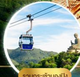
รวมกระเช้าฮ่องกง