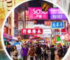
Shopping Taim Sha Tsui