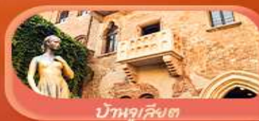
บ้านจูเลียต

เวนิส มิลาน เวโรนา ซูริก ลูเซิร์น โลซาน เซอร์แมท