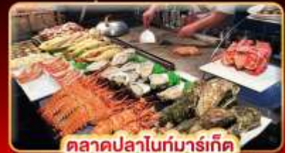
ตลาดปลาไนท์มาร์เก็ต