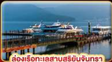
ล่องเรือทะเลสาบสุริยจันทร์

บ๊ี้แด้ม STREET FOOD แบบจุใจ ขอความรักวัดแดงชาแน