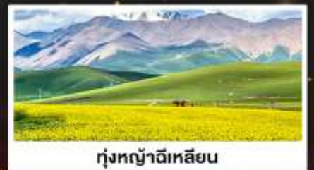
ทุ่งหญ้าจีเหลียน