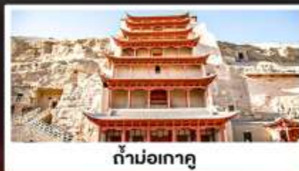
ถ้ำม่อเกาตุ