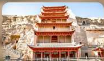
กำม่อเกาคู