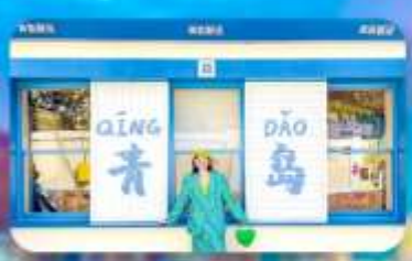
ถนนหลงเจียง