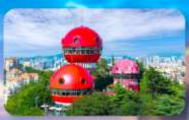
จุดชมวิว SIGNAL HILL