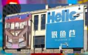
ตรอกซิลเวอร์ฟิช