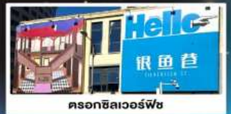
รถอู๋ซิลเวอร์ฟิช