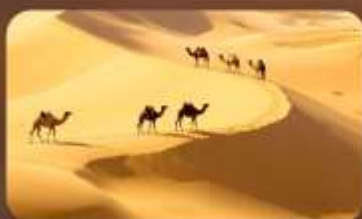
เนินทรายเสียงชวาน