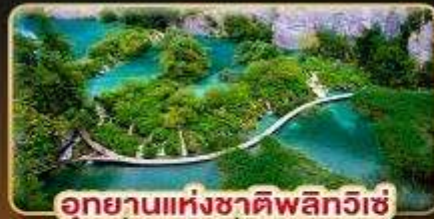
อุทยานแห่งชาติพลิตวิเช