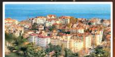
จุดชมวิว Signal Hill Park