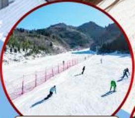
ลานสกีจินซาน