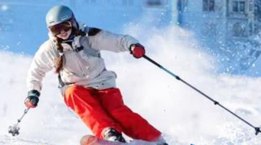
เล่นสกีทะเลยหิมะ เมืองเมืองแห่งน้ำพุ ชานตง