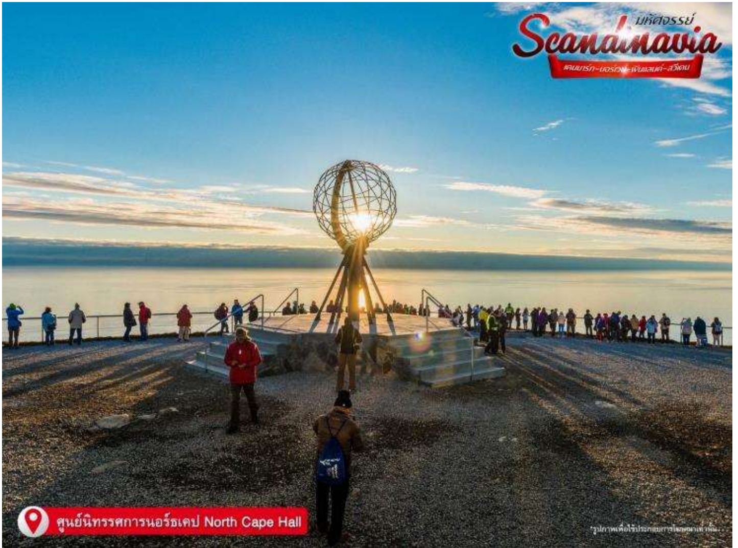
📍 ศูนย์นิทรรศการนอร์เวย์ North Cape Hall

รูปภาพเพื่อใช้ประกอบเนื้อหาในเอกสารเท่านั้น