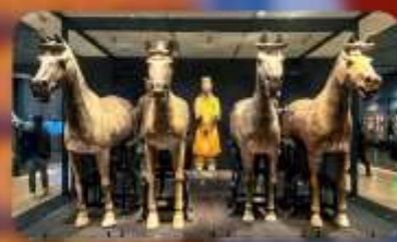
สุสานทหารจิ้งซี