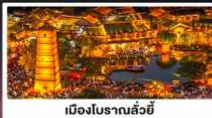
เมืองโบราณลั่วหยี่