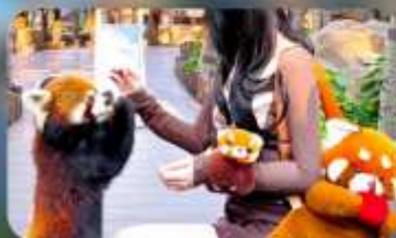
ให้อาหารแพนด้าแดง