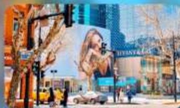
ถนนทวยไห้มิดเคิ้ลโรัด