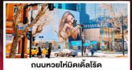
ถนนหยอไห่มีดิลล์โรด