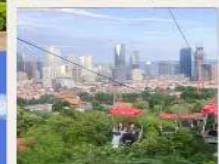
กระเช้าชมเมือง