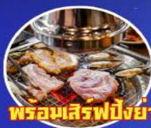
พร้อมเสิร์ฟปิ้งย่างเกาหลี