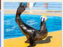
POLAR OCEAN PARK