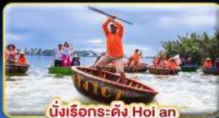
นั่งเรือระดั่ง Hoi an