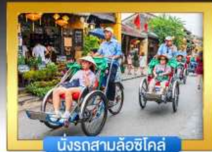
นั่งรถสามล้อซีโคล์