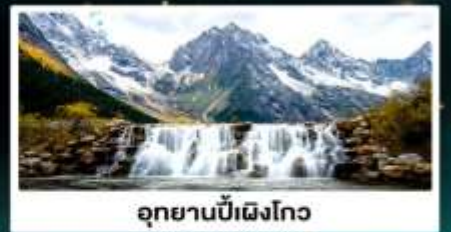
อุทยานปี้เฉิงโกว