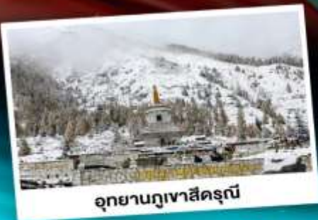
อุทยานกุเวาสีดรุณี

เที่ยว 3 อุทยานสวรรค์ สัมผัสบรรยากาศหน้าหนาว "แดนมังกร"