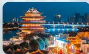
ถนนสามสายสองตรอก