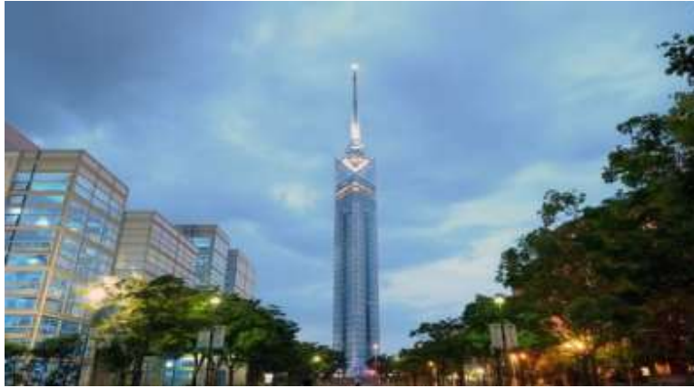
Fukuoka Tower หอคอยตึกระฟ้าที่สูงที่สุดในประเทศญี่ปุ่นถึง 234 เมตร

สถานที่ท่องเที่ยวที่ได้รับความนิยมมากที่สุดในฟูกูโอกะ: